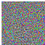
\text{sign}(\nabla_x J(\theta, x, y)) “nematode” 8.2% confidence