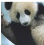
x “panda” 57.7% confidence